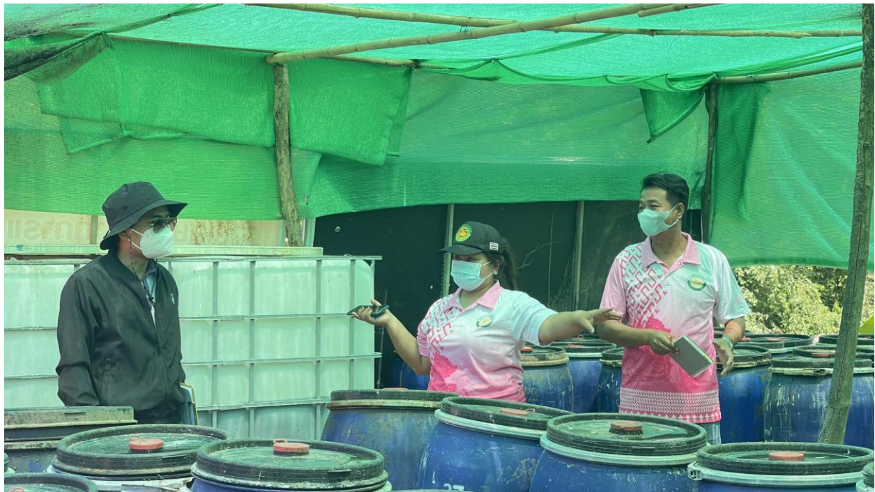
กิจกรรมที่ ๓ โครงการท้องถิ่นอาสาร่วมใจปลูกต้นไม้เพิ่มพื้นที่สีเขียว