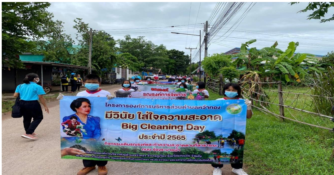
กิจกรรมที่ ๔ กิจกรรม Big Cleaning Day