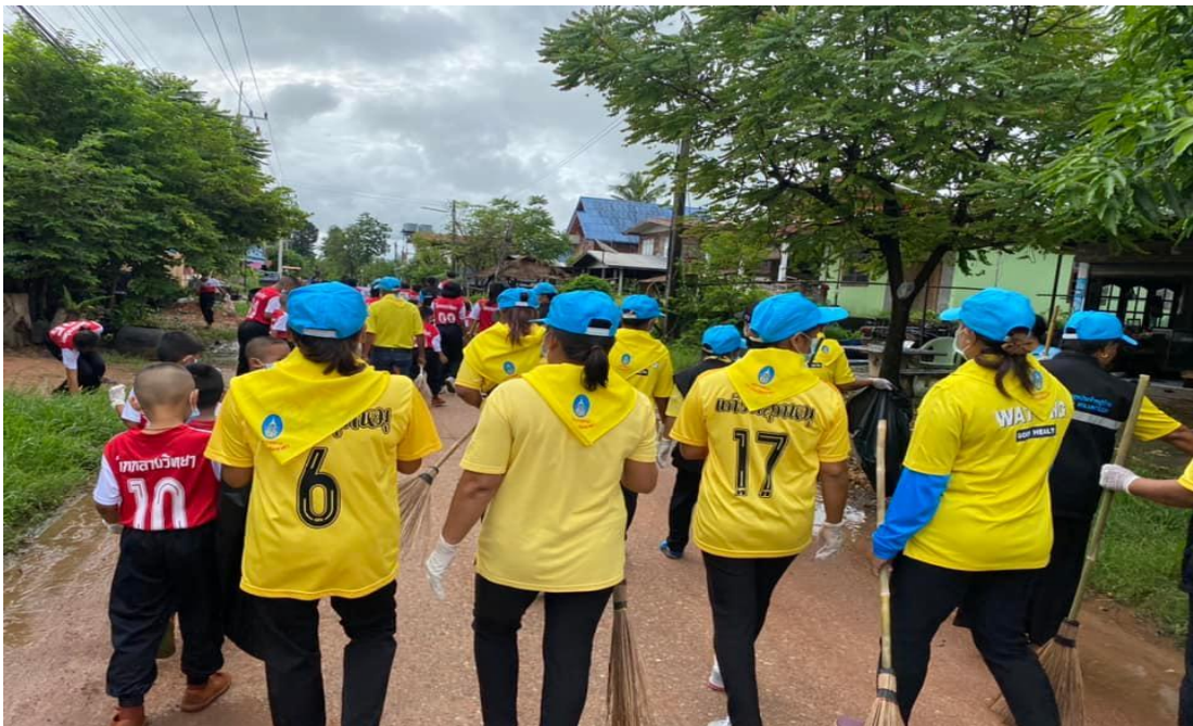
๒.กิจกรรมภายใต้โครงการอนุรักษ์พันธุกรรมพืช