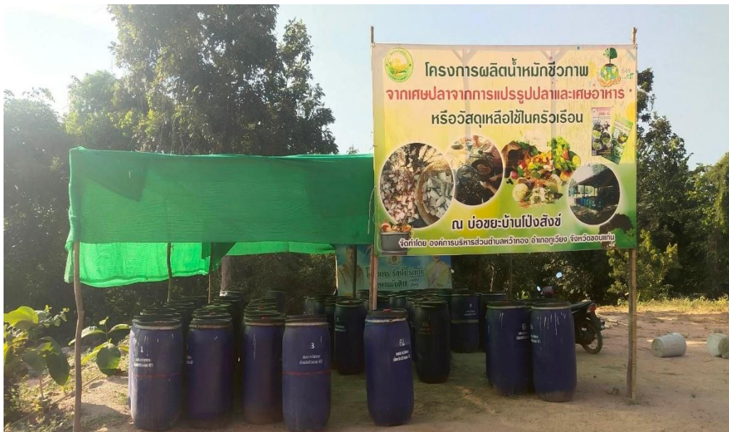
กิจกรรมที่ ๒ โครงการผลิตน้ำหมักชีวภาพจากเศษปลาจากการ